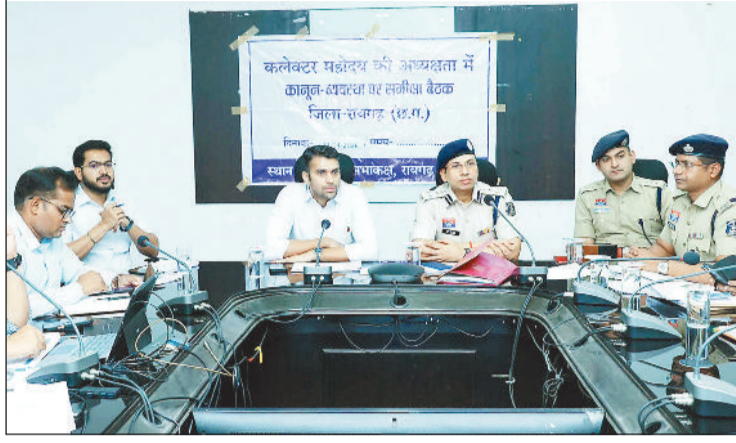
बैठक लेते कलेक्टर और एसएसपी।

बैठक में वरिष्ठ पुलिस अधिकारियों सहित संबंधित विभागों के अधिकारियों ने एजेंडा वाद विद्वानों पर विस्तार से चर्चा करते हुए टोस रणनीति तय की और आवश्यक दिशा निर्देश जारी किए। इसके लिए सामान्य प्रशासन, पुलिस, यातायात एवं परिवहन विभाग की संयुक्त टीम गठित कर समन्वित रूप से कार्रवाई करने को कहा गया। हिट एंड रन के लंबित प्रकरणों की समीक्षा करते हुए उनके शीघ्र निराकरण पर जोर दिया गया। साथ ही